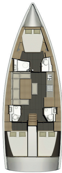
3 cab / 3 heads Long. galley