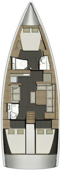
3 cab / 2 heads Front galley (Standard)